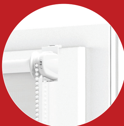
ZAVĚŠENÍ NA VĚŠÁKY