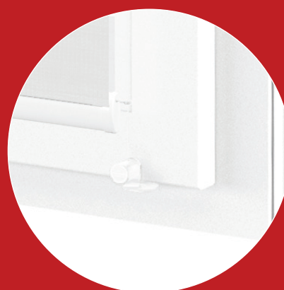
FIXACE VODICÍM LANKEM